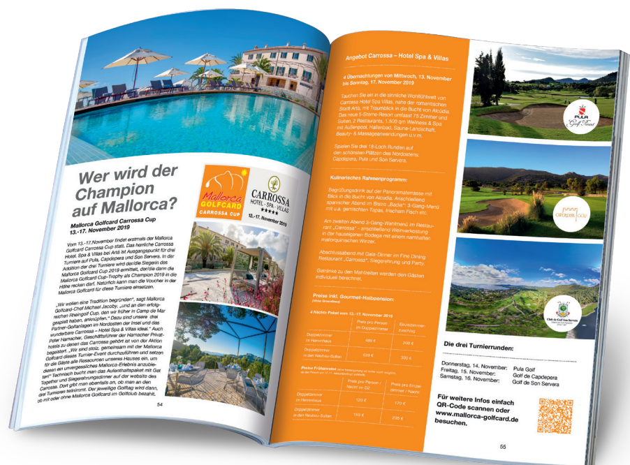
Turnier- und Hotelvorstellung im RHEINGOLF Magazin