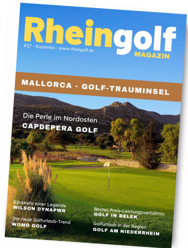
Titelseite des RHEINGOLF Magazins

DIN A4 (B/H in mm: 210 x 297), komplett in 4c gedruckt, Offsetdruck