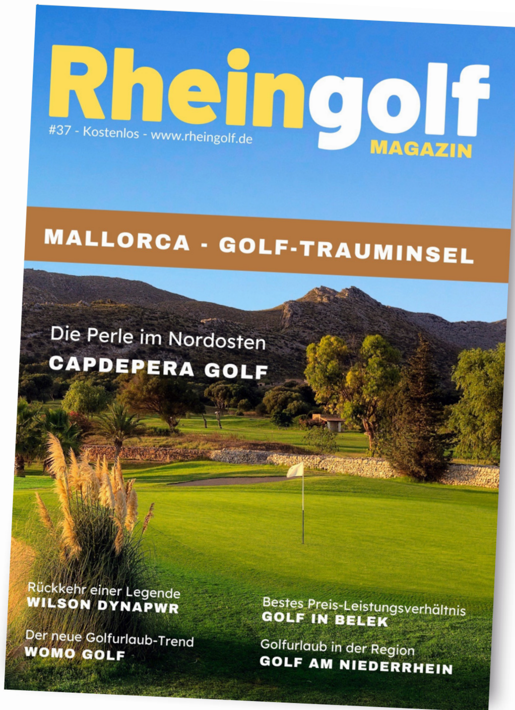
Titelseite des RHEINGOLF Magazin

Das RHEINGOLF MAGAZIN online durchblättern auf www.rheingolf.de